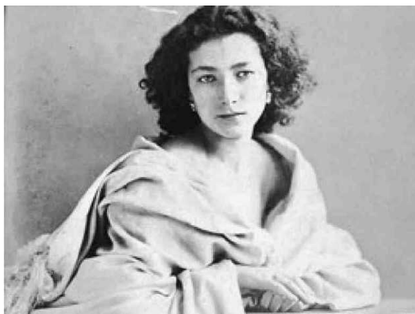
Sarah Bernhardt, fotografiada per Nadar.